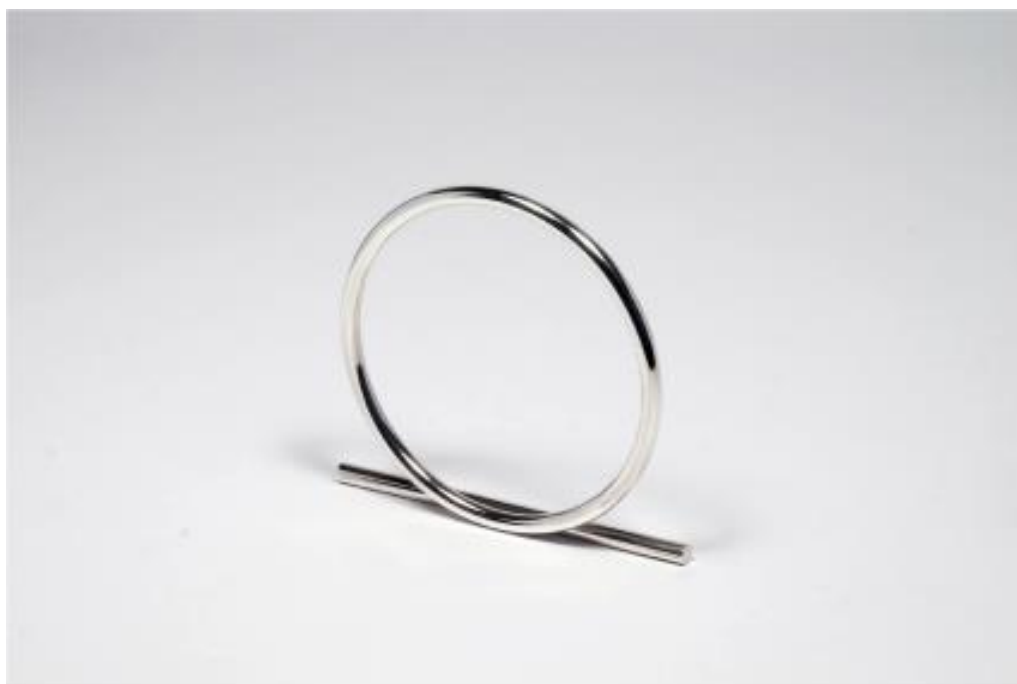
Marc Monzó, Moon armband, 2016

In zesendertig jaar is een initiatief van vrienden en familie uitgegroeid tot een internationaal gerenommeerde stichting die niet weg te denken is in de wereld van het hedendaagse sieraad. Nog steeds staat de zichtbaarheid van kunstenaars centraal in onze activiteiten en blijven we vasthouden aan wat de oprichters in 1980 zo mooi verwoordden als 'het élan van Françoise'. Het werk van stichting kwam dit jaar door verschillende activiteiten onder de aandacht, hierbij een verslag.