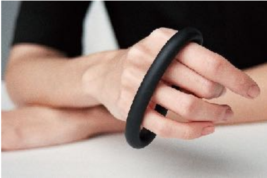
Triin Kukk Black Jade , 2019

In mei, juni en juli 2020 zou de Estse sieraadontwerper Triin Kukk naar Amsterdam komen voor een kunstenaarsverblijf in Studio Rian de Jong. Helaas heeft de coronacrisis voor verschuivingen in het kunstenaarsprogramma gezorgd. Het verblijf van Triin Kukk is in overleg eerst verschoven naar 2021 en vervolgens naar 2022.