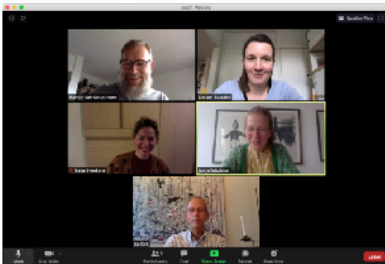
Bestuursvergadering, 18 mei 2020

Het bestuur vergaderde in 2020 een keer fysiek en vier keer online. Er vonden dit jaar geen bestuurswisselingen plaats.