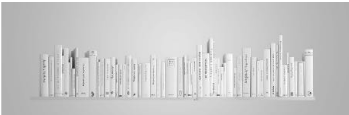
Lin Cheung (V.K., 1971), Jewellery Library , 2007/2019. Installatie van 200 boeken, diverse afmetingen, boeken, papieren kft Dubbelzijdige poster (editie 250), 2008. Schenking kunstenaar, 2020

De stichting ontving de installatie Jewellery Library van de Britse sieraadontwerper Lin Cheung ter gelegenheid van het 40-jarig bestaan. Lin Cheung, winnaar van de Françoise van den Bosch Prijs 2018, installeerde het werk in november 2019 in de bibliotheek van het Stedelijk Museum, ter gelegenheid van de prijsuitreiking en het symposium The Relevance of Crafts . Jewellery Library bestaat uit 200 boeken, was eerder te zien in Hatfield, London, Portsmouth en Edinburgh en wordt in 2021 in langdurig bruikleen aan het Stedelijk Museum overgedragen.